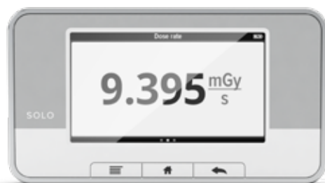
シングルビュー 選択したパラメータの拡大表示。