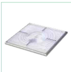
RAYSAFE P FLUORO ファントム