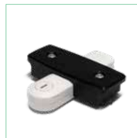
X2吸着カップホル ダー

Unfors RaySafeは、医療現場でのX線装置の性能測定、スタッフ被ばくのリアルタイムモニタリング、患者のためのX線被ばく管理に包括的なソリューションを提供いたします。