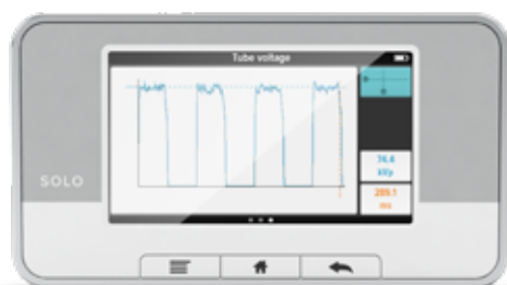
波形 kVp、線量率、またはmAの概要 および簡易解析。