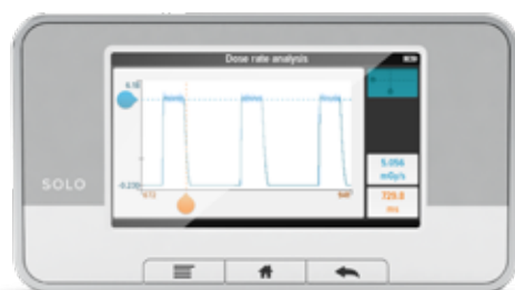
解析モード 波形を拡大表示して、パルスのピーク 線量率などを特定。