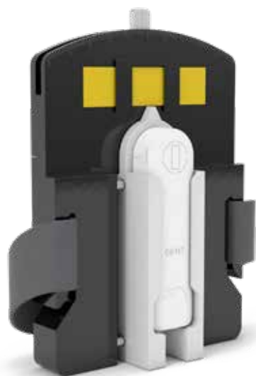
X2パノラマホルダー