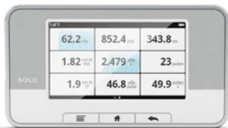
ホームスクリーン 1～12種のパラメータを同時測定、 波形も表示。

行った照射はすべてベースユニットに保存されます。セッションの途中でスワイプすると、前の照射に即座に戻って参照や比較などが行えます。終了した測定セッションを無償提供されるX2 Viewソフトウェアにアップロードしておく、後日にデータ処理などが行えます。