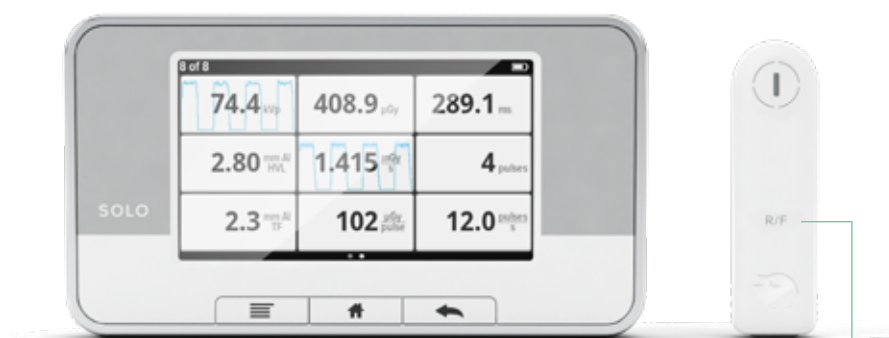
RAYSAFE X2 SOLO R/F