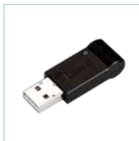
X2 BLUETOOTH アダプター