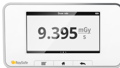
シングルビュー 選択したパラメータの拡大表示。