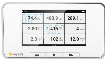
ホームスクリーン 9 ~ 12種のパラメータを同時測定、 各パラメータの波形も表示。

すべての照射の測定結果はベースユニットに保存されます。セッションの途中でスクリーンをスワイプすると、以前に収集した照射データに即座に戻って参照や比較などができます。終了した測定セッションはすべて X2 View ソフトウェアにアップロード可能で、別の機会にデータ処理などが行えます。