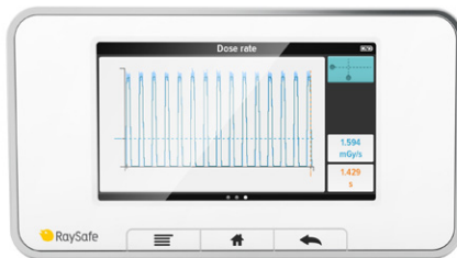
波形 kVp、線量率、または mA の概要および 簡易分析。